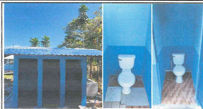
Foto 2: Sustitución del techo de los baños lámina por lámina troquelada y estructura de soporte madera por metal, así como mantenimiento de las puertas y sustitución de los inodoros