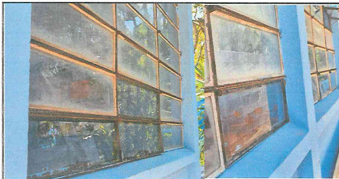
Foto 3: Sustitución de vidrios en ventanería, quedando así después del trabajo realizado