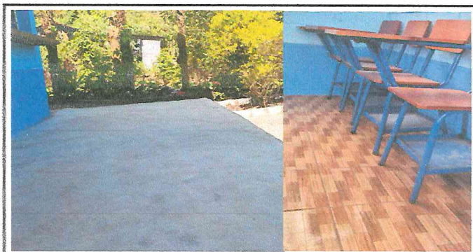
Foto 4: Sustitución de piso de torta de concreto, quedando de ésta manera el trabajo realizado.