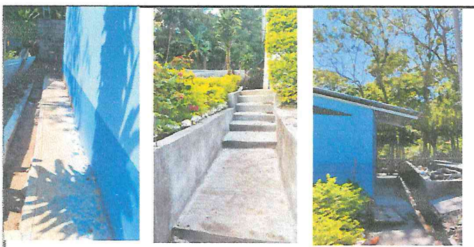
Foto 6: Reparación de cunetas y banquetas, quedando de esta forma el trabajo que se realizó.--

Observación: Si es necesario se pueden agregar hojas adicionales y actualizar el número de hojas.