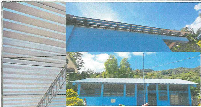
Foto 1: Sustitución de techo de lámina por lámina troquelada debido a la antigüedad y del otro edificio sustitución por la caída de un árbol, quedando así el trabajo realizado.